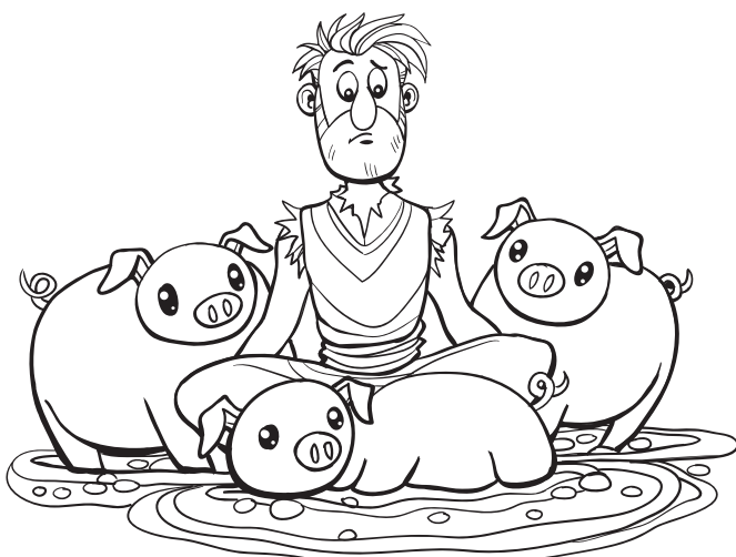
El hijo pródigo huyó de casa.