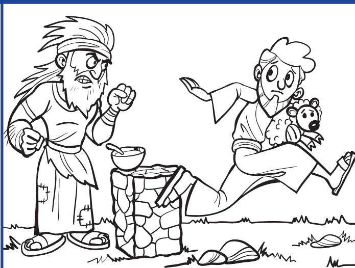
Jacob engañó a su hermano.